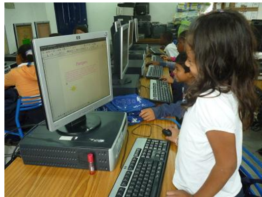
Niños y Niñas de la Fundación las Golondrinas Apropian las TIC