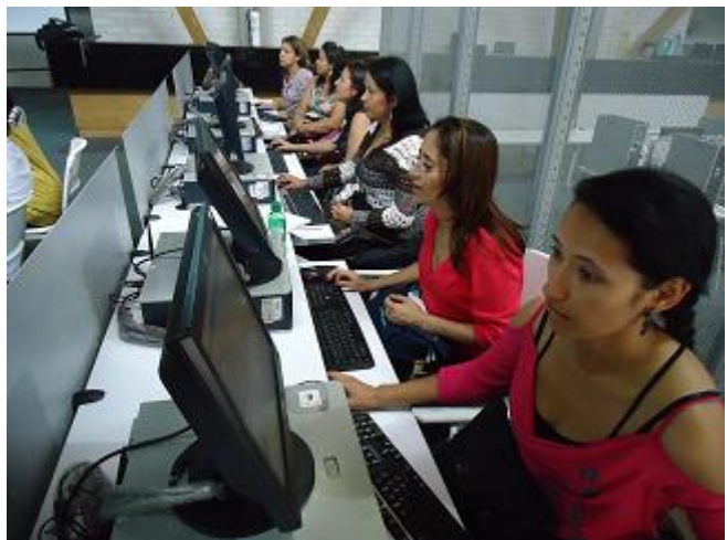
Personal de Centros de Formación Familiar Apropia las TIC