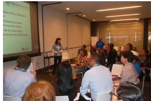
Taller sobre Cooperación y Desarrollo en Conferencia Beyond Access