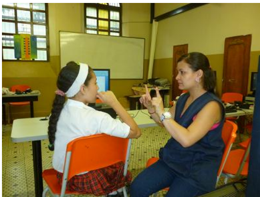
Aprendiendo con Lenguaje de señas - Intel Aprender

Makaia cuenta con formadores capacitados para replicar las metodologías Intel Aprender (niños y jóvenes de 8 a 18 años), Intel Easy Steps (Adultos), Ser Activo (Adultos mayores y personas en situación de discapacidad)