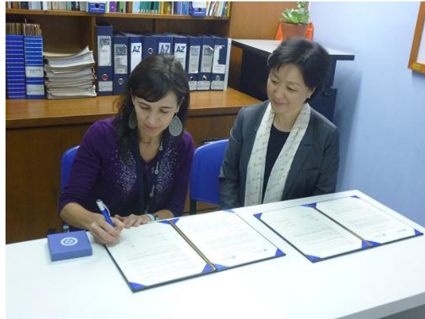
Firma de Acuerdo con Sookmyung Women's University